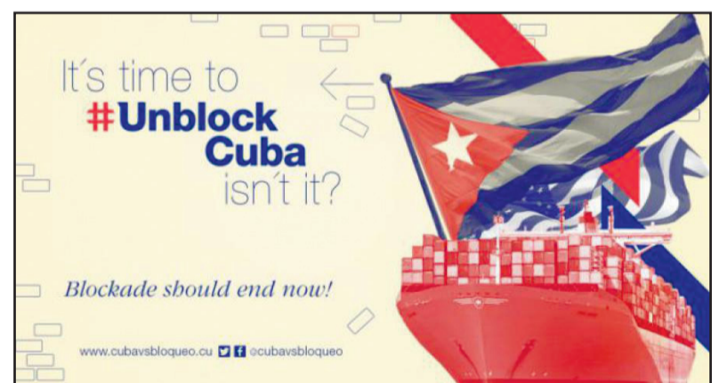
Stop VS-Blokkade van Cuba.

Gezamenlijke verklaring van communistische- en arbeiderspartijen