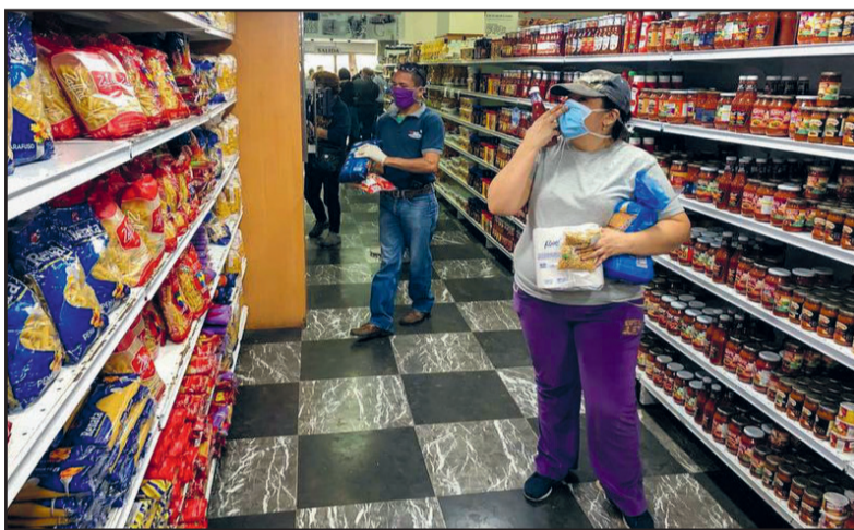
Beeld van een supermarkt in Caracas op 27 april jl. Het winkelend publiek is vooral benieuwd naar de prijzen, omdat de regering de prijscontrole van 27 basisgoederen heeft vrijgegeven.

Bron: Tribuna Popular: Communistische Partij van Venezuela, vertaling: Alejandro de Mello.