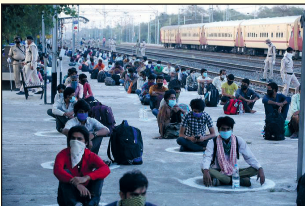
Op 2 mei jl. in Bhopal, India, wachtten treinreizigers op een van de weinige treinen richting de geboortedorpen. Veel arbeidsmigranten die van het platteland komen, zijn het werk in de grote steden kwijtgeraakt door de lockdown.

onvermijdelijk en progressief is, doen alle moeite om de politieke voorlichting en organisatie van hun kameraden uit de achtergebleven landen te ondersteunen."