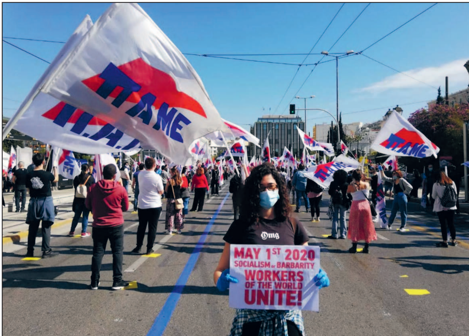
1 mei-demonstratie PAME in Athene.

De wereldeconomie is bijna tot stilstand gekomen. Wat kunnen we ervan leren?