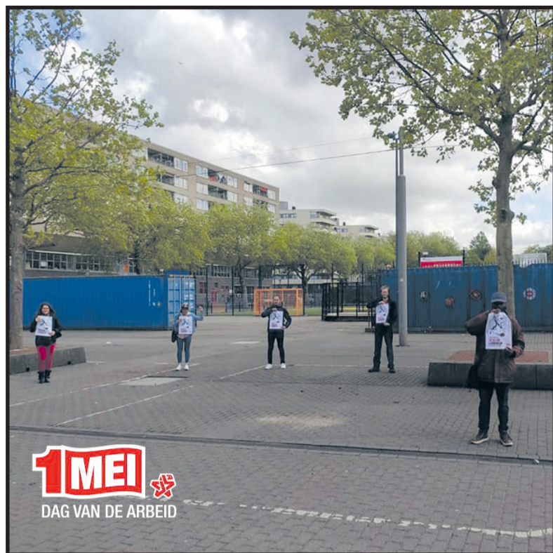
Actie CJB.