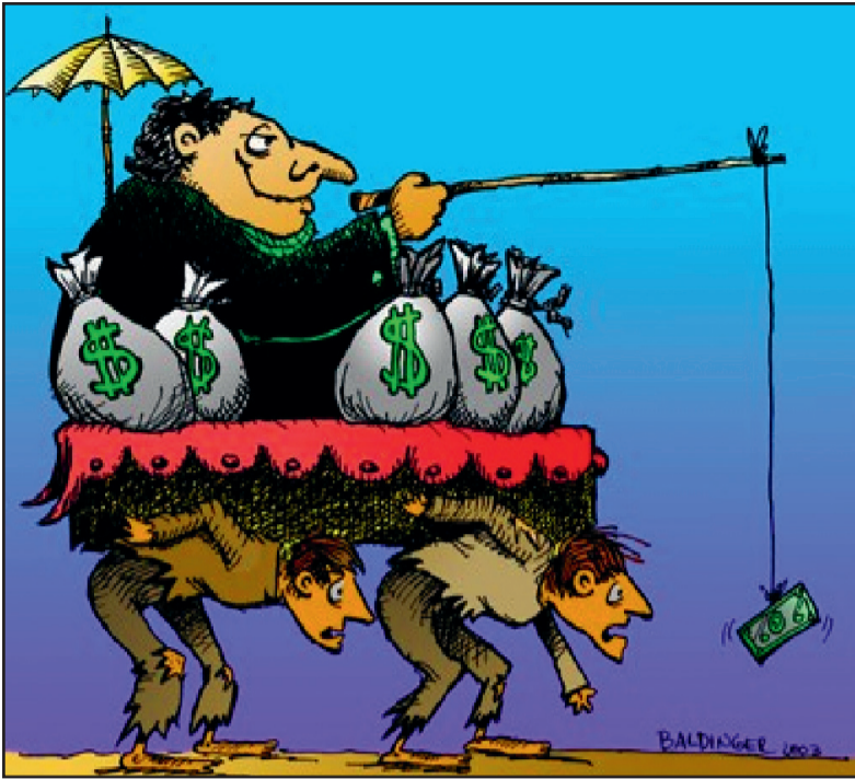
Kapitalisme is uitbuiting.

- internationaal solidair gecoördineerd, via netwerken en planmatig - de dreigende problemen voor de mensheid om te lossen, gaat de rui-