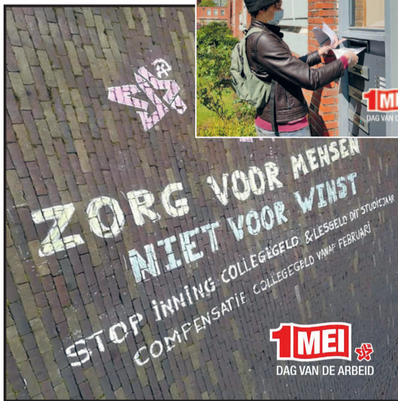
CJB in actie op 1 mei.