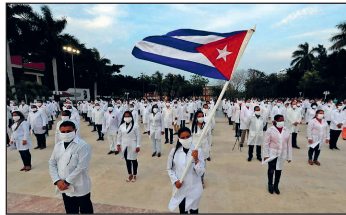
Een manifestatie van Cubaanse artsen bij het vliegveld van Havana op 25 april jl., voordat zij afreizen naar Zuid-Afrika met een groep van 216 artsen om te helpen bij de Covid19-pandemie.

(*) Bron: Cubanismo.be via 'De WereldMorgen', donderdag 26 maart 2020.