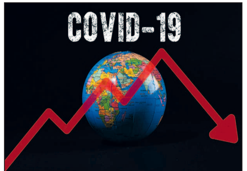
Wereldwijde acties bij het tegengaan van Covid-19, waarbij Cubaanse artsen in veel landen een belangrijke rol spelen, hebben de verspreiding geremd.

Ook voor onze dokters uiten we onze bijzondere erkenning, respect en bewondering, waar ze ook zijn. Zij staan vol onbaatzuchtig binnen en buiten Cuba tegenover deze pandemie, waarmee ze beantwoorden aan de oproep van de Cubaanse overheid om de humanitaire kiem van Martí en Fidel te verspreiden. In tegenstelling tot de handelingen zoals die van de Verenigde Staten