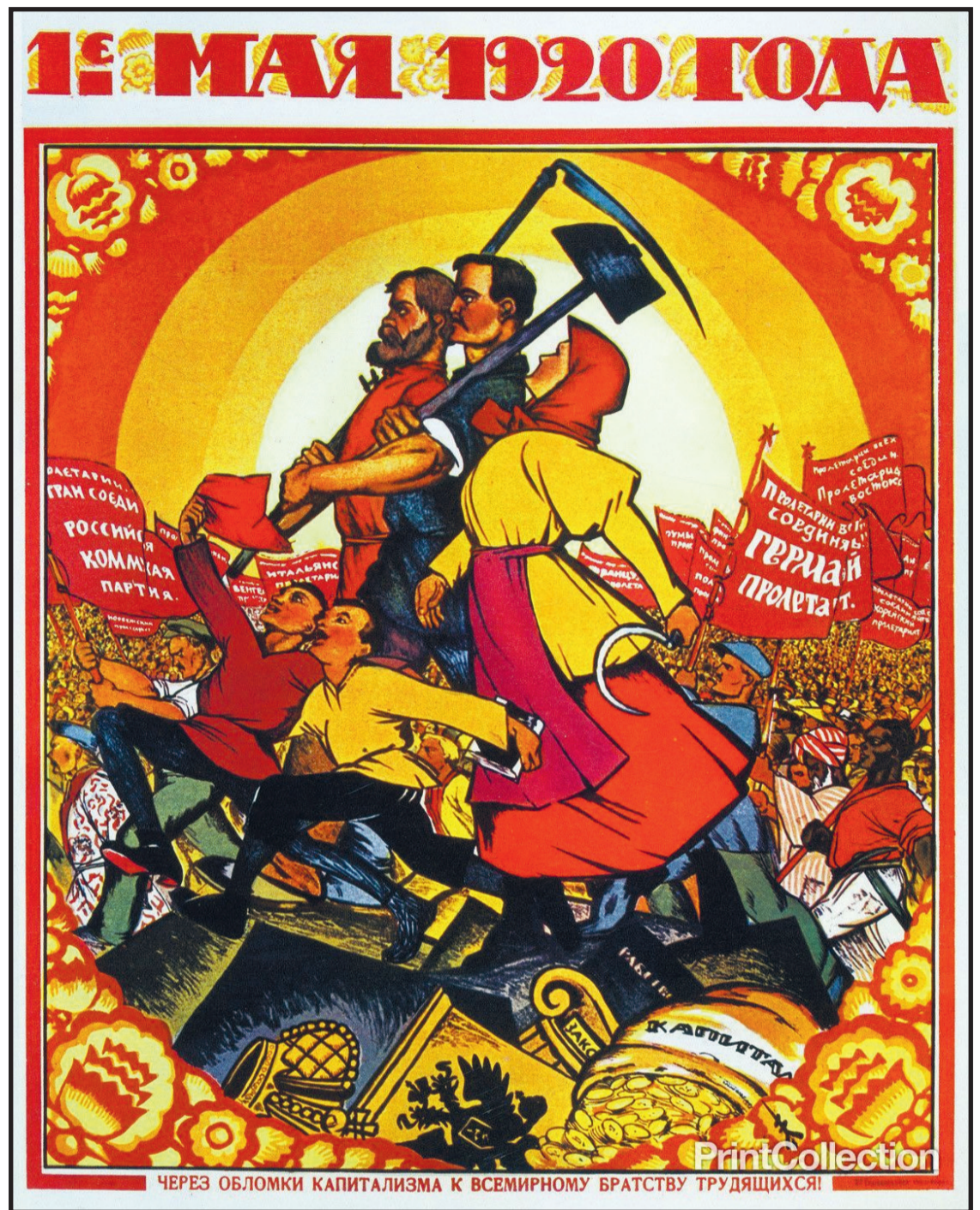
Viering in de USSR in 1920.