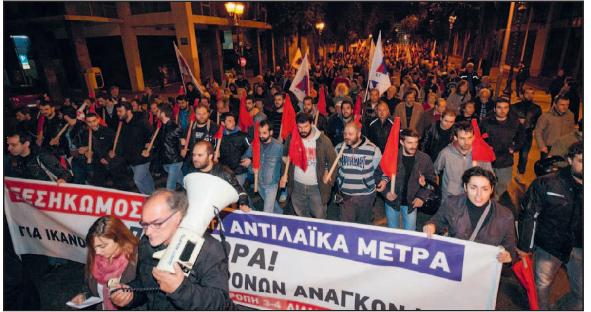
Na het bekend worden van nieuwe maatregelen die de rechten van de Griekse arbeidersklasse aantastten gingen actievoerders van PAME op 7 december jl. direct de straat op om te protesteren. De continue en massale druk vanuit 'de straat' noopte de regering tot vervroegde verkiezingen.

De hele logica heeft verder haar voorgeschiedenis in de 18de eeuwse kleinburgerlijke utopische socialisten en de 19de eeuwse Bernstein, zoals hierboven aangestipt. Bij tijd en wijle wordt ook Rousseau's 'Sociale Contract' opgerakeld. Dit alles blijft de denktank waaruit elke sociaaldemocratische stroming in een nieuw jasje put - de Oktober Revolutie van 1917 wordt zorgvuldig buiten beschouwing gelaten, deze valt onder het kopje 'extremen' en daar moet de echte 'gemiddelde mens' niets van hebben - maar dan wel met een telkens aangepaste woordenschat.