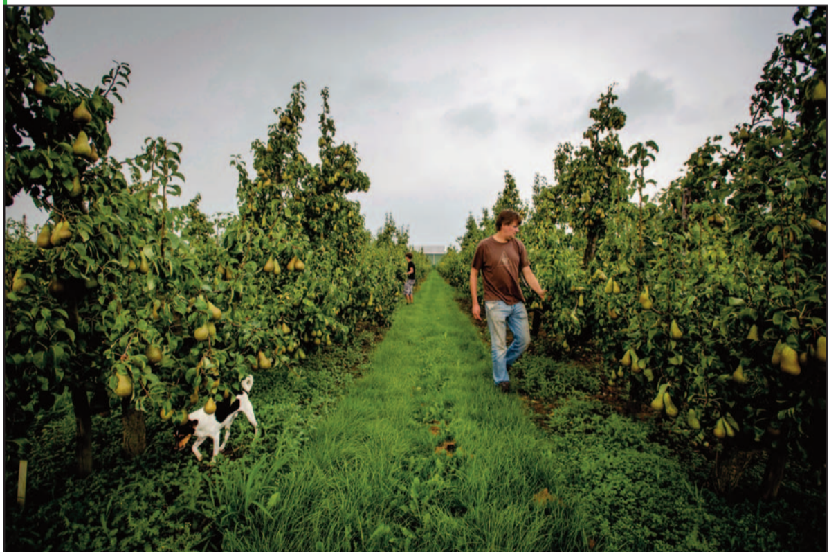
Een Nederlandse tuinder inspecteert zijn perenboomgaard. Normaal wordt 40 procent van de peren geëxporteerd naar Rusland. De boycot raakt de Nederlandse tuinders hard.

Maar geen enkele centrale bank ter wereld is in staat om de groei van de handel, de motor van de productie en werkgelegenheid,