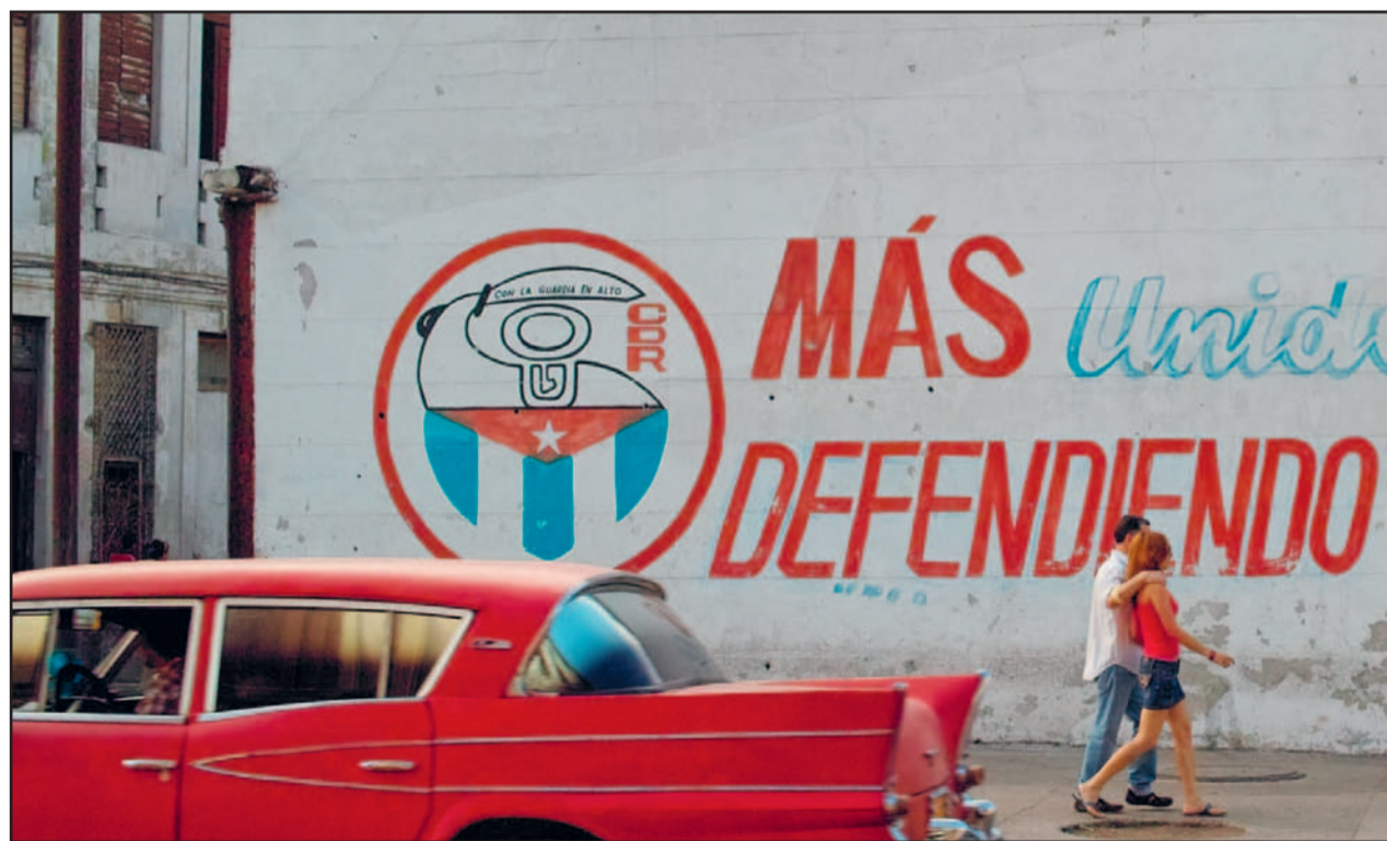
Muurschildering in Havana die oproept het socialisme te verdedigen.

Een tweede reden moet je gaan zoeken bij de economische lobby's in de VS. Door zijn gunstige ligging en door de kantelende wereldverhoudingen wint Cuba de laatste jaren aan economisch belang. Brazilië investeert volop in een nieuwe diepzeehaven in de buurt van Havana, Mariel. Het lapt daarmee de VS-blokkade aan zijn laars. Die haven