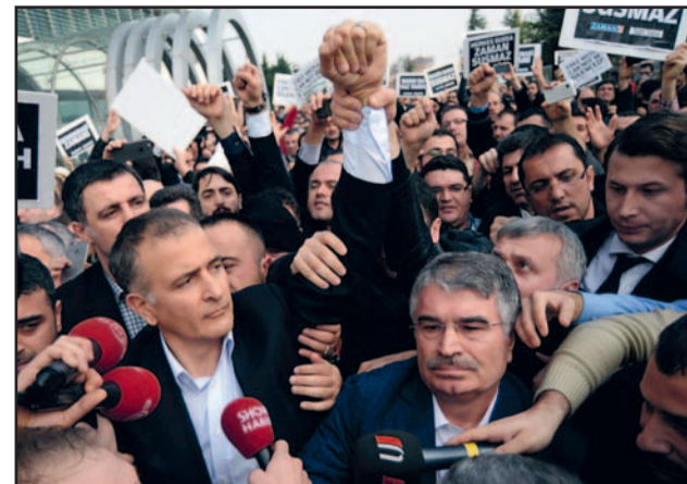
In burger geklede Turkse politie arresteert de hoofdredacteur van het blad Zaman. Dit is onderdeel van de opgevoerde mediarepressie door de Turkse president, die steeds meer in conflict raakt met zijn vroegere bondgenoot, de islamitische prediker Fethullah Gülen die vanuit de VS opereert. Deze schermutselingen leiden af van de noodzakelijke klassenstrijd.