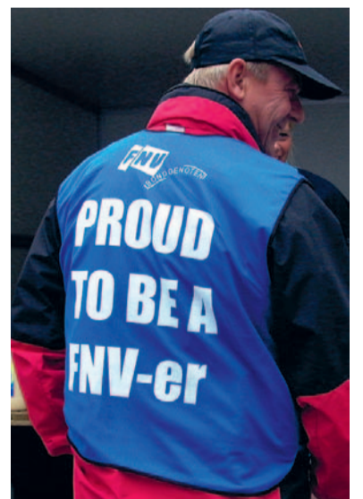
Voor nu: sta samen sterk in de vakbeweging!

De aard van het kapitalisme wordt vooral zichtbaar in de beantwoording van de vraag hoe er met de werkenden wordt omgegaan. Hoe wordt geanticipeerd op nieuwe economische ontwikkelingen? Hoe wordt omgegaan met het menselijk kapitaal? Meestal worden de betrokken werknemers min of meer gedumpt en een of andere sociale regeling ingejaagd. Alleen de topspecialisten krijgen nieuwe kansen. Van systematische omscholing en trajecten van werk naar werk is meestal geen sprake. De moordende onderlinge kapitalistische concurrentie tussen bedrijven laat geen ruimte voor een menselijke aanpak. Zo ziet het kapitalisme er uit. Werknemers zijn