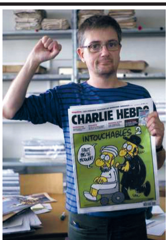
De hoofdredacteur van Charlie Hebdo, het progressieve Franse satirische weekblad, houdt het blad omhoog dat gemaakt is na een brandbomaanslag in 2011. Stéphane Charbonnier werd vorige week door terroristen vermoord, samen met 11 anderen, waaronder mederedactieleden. Zie voor verklaring NCPN: www.ncpn.nl.