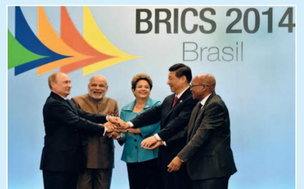
Foto: De presidenten van de BRICS-landen, vlnr Poetin-Rusland, Mori-India, Rousseff-Brazilië, Xi-China en Zuma-Zuid-Afrika, tijdens de top in 2014 in Brazilië. Het Westen vormt geen enkele garantie voor Vrede en Democratie.