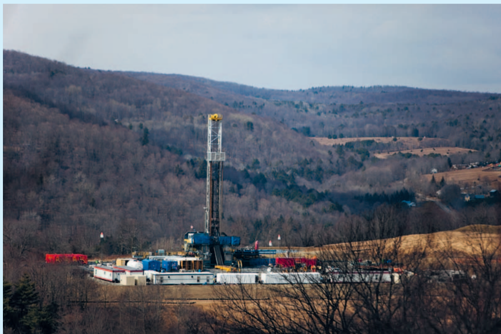
Fracking in de staat Pennsylvania in de VS: een zeer milieu-onvriendelijke vorm van olie- en gaswinning. De dalende olieprijs brengt de met schulden overladen Amerikaanse olie-maatschappijen die aan fracking doen in grote problemen.

(*) Zie op de website www.ncpn.nl : vertaling door Wiebe Eekman van IVV-verklaring.