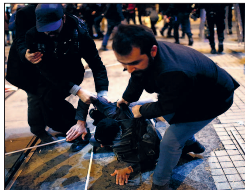
Gedurende een demonstratie tegen de aanval van de IS op Kobane op 1 december jl. wordt een demonstrant hardhandig gearresteerd door de Turkse politie. De Turkse staat speelt een smerig spel: aan de ene kant het opstoken van de onrust in Syrië, volledige steun aan het westers imperialisme als NAVO-lid en brute onderdrukking van de eigen (Koerdische) bevolking.