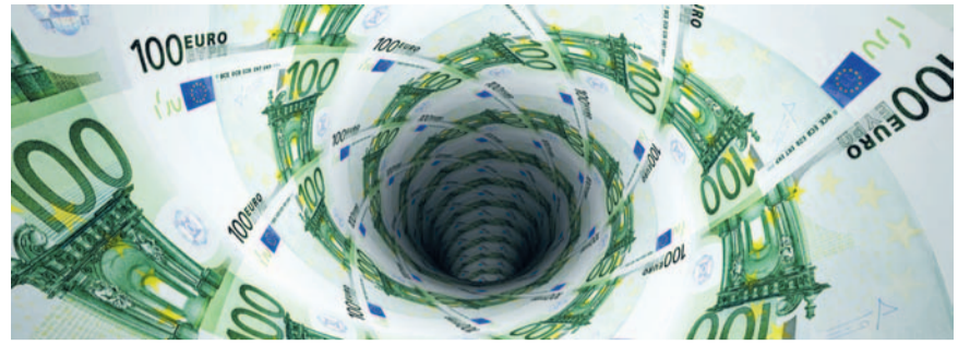
Bijstandsgerechtigden verdwijnen steeds meer in donker gat.

Is het sociaal beleid om mensen die al eens uitgespuwd zijn, met veel dwang en valse beloften richting arbeidsmarkt te bewegen, waarop steeds harder de kapitalistische concurrentie de werkgevers dwingt arbeid zoveel mogelijk uit te buiten? Doel van linkse politiek moet zijn om klassenbewust macht op te bouwen, in organisaties, in bedrijven, in de buurt en zo vanuit die nieuwe positie met collectieve eisen de wereld van de arbeid terug te veroveren op het kapitaal en die weer leefbaar en gezond te maken.